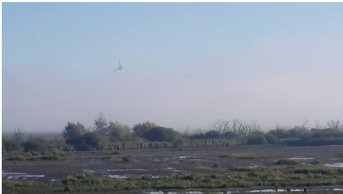
Harderbroek met windmolen, vanaf de Biezenburcht. Mist trekt op.

de zon en droog. Middenin het gebied ook een houten uitkijkhut, aan het eind van het Laarzenpad. Soms heel erg drassig, was nu net te doen. Als we bij het gebied aankomen is het behoorlijk mistig. We stoppen eerst bij de Biezenburcht, het uitkijkpunt aan de zuidwest kant. Nog niet veel te zien, dus eerst koffie.